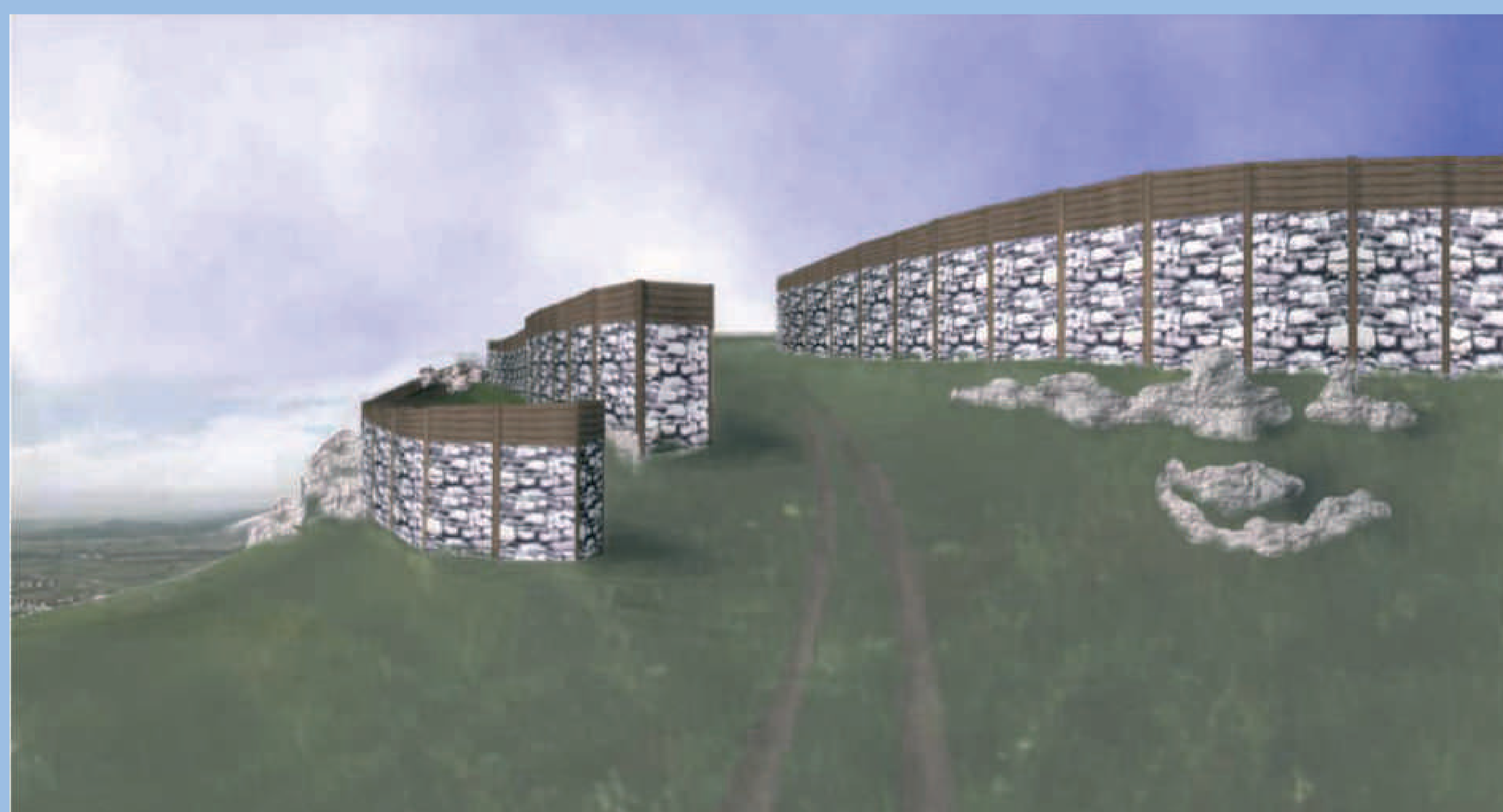
Rekonstruktion des Haupttores des 5. Jh. v. Chr.

■ Die strategische Position des Schlossbergs einerseits und die hoch komplizierte Befestigungsarchitektur andererseits verdeutlichen die vorzüglichen Kenntnisse im Befestigungsbau, die erst im hohen Mittelalter ihresgleichen finden sollten!